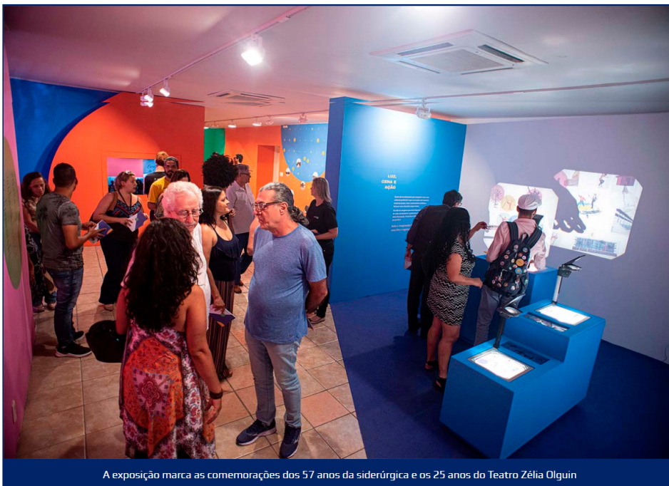
A exposição marca as comemorações dos 57 anos da siderúrgica e os 25 anos do Teatro Zélia Olguin

Por: Redação . CN Em: 04 de novembro de 2019 Cultura &amp; Entretenimento, Vale do Aço